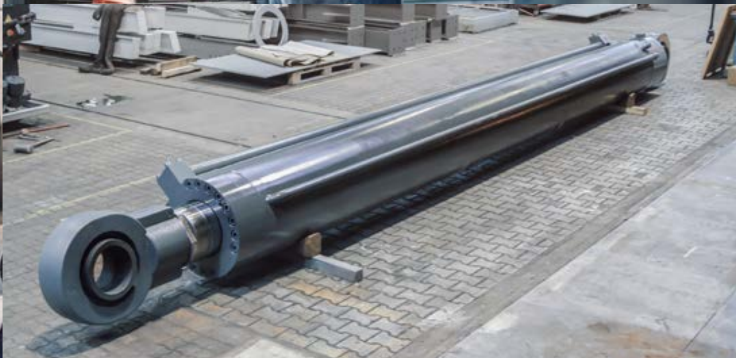
Plungerzylinder (Mantel wassergekühlt, Kolbenstange ölgekühlt, Wegmesssystem)