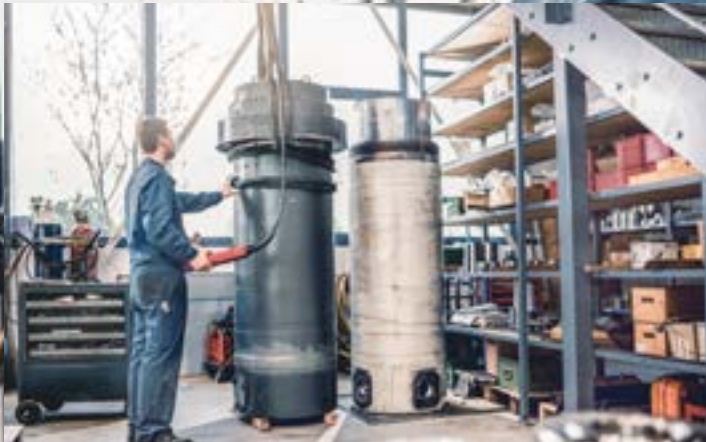
Service für Sonderzylinder

Getreu diesem Motto werden bei der KAUTZ Technologies GmbH Sonderzylinder produziert. Diese finden in allen Bereichen Verwendung, in denen normale Standardzylinderreihen nicht die passende Lösung bieten.